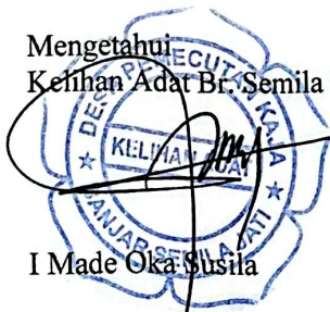
I Made Oka Susila