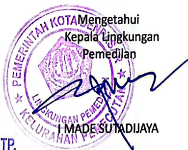
Mengetahui Kepala Lingkungan Pemedilan