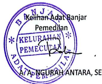
Keluhan Adat Banjar Pemedilan