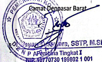
N.P. APembina Tingkat I