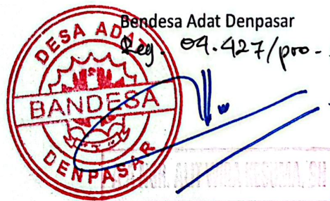
Bendesa Adat Denpasar