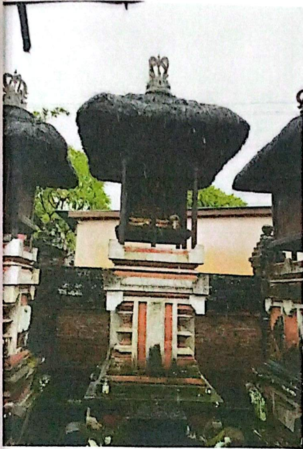
(Gedong Menjang Seluang)