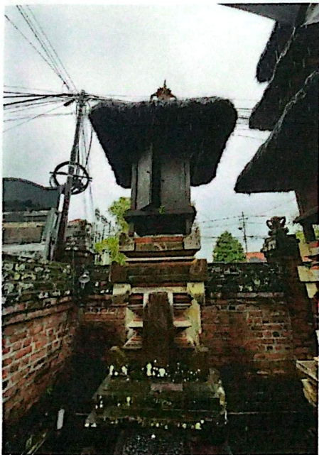
(Gedong Gunung Agung)