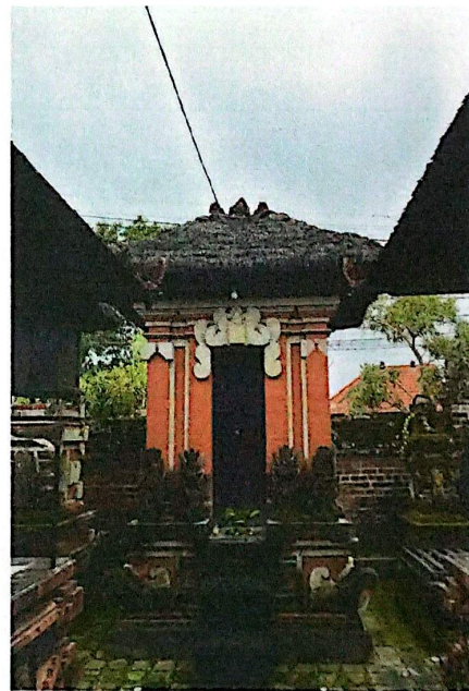
(Gedong Dewata Dewati)