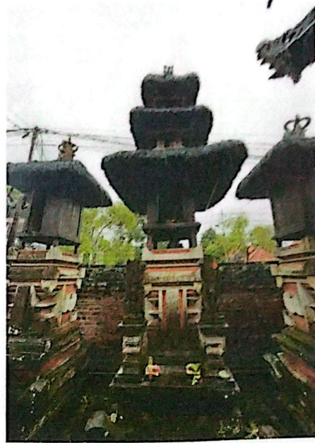
(Gedong Pemayun Pemuteran Jagat)