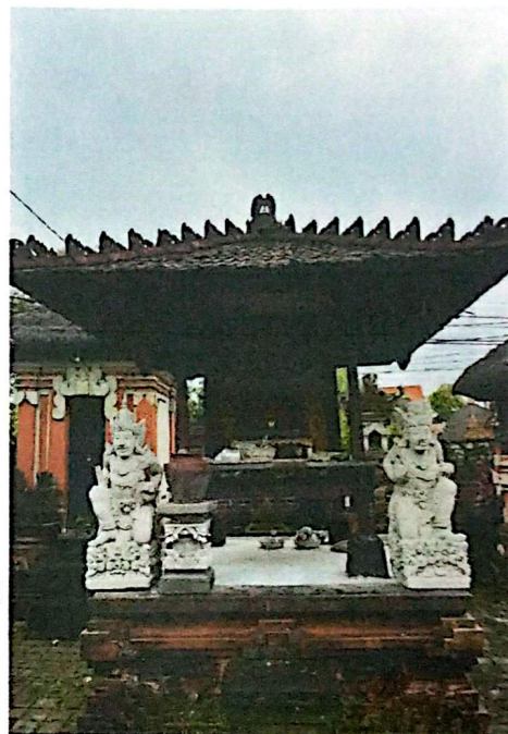
(Tajuk Dewa Hyang)