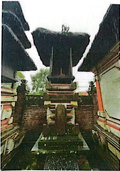
(Gedong Tambang Badung)