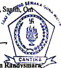
I Nym Danu Daksawan Randysmara