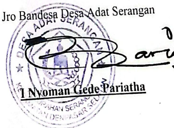
foto. 28/11/2026 Camat Denpasar Selatan