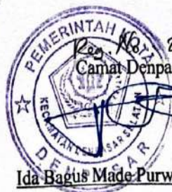
Reg. No. 20/1/2026 Camat Denpasar Selatan,