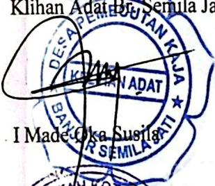
I Made Oka Susila

Mengetahui Perbekel Desa Perdecutan Kaja