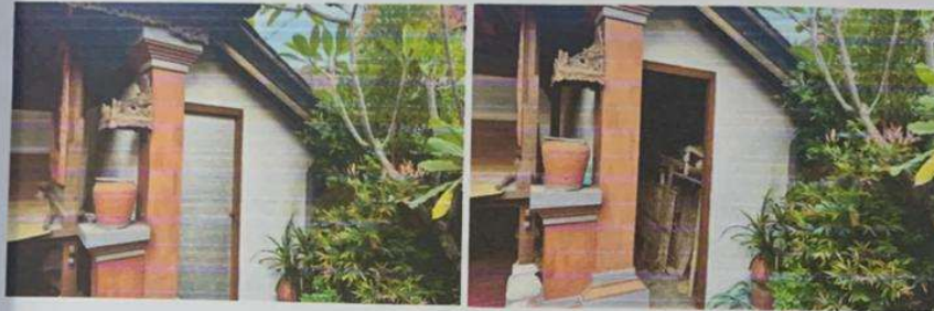
FOTO DOKUMENTASI DADIA BENDESA MANIK MAS Br.GERENCENG, DESA PEMECUTAN KAJA