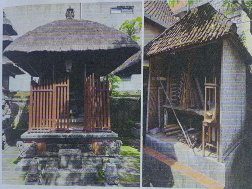
FOTO DOKUMENTASI MERAJAN DALEM SEGENING Br.PANTI GEDE, DESA PEMECUTAN KAJA