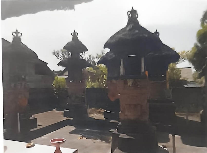
PHOTO PELINGGIH SEBELUM DIPERBAIKI.

Jl. Jatayu No.5 Denpasar, Br.Anggabaya Penatih Denpasar Timur, Telp. 081236431370