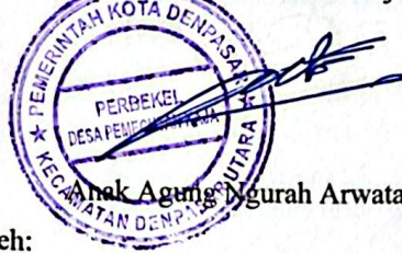
Anak Agung Ngurah Arwata

Res No. 24 / um / 4 / 2020 Kepala Desa Pemecutan Kaja,