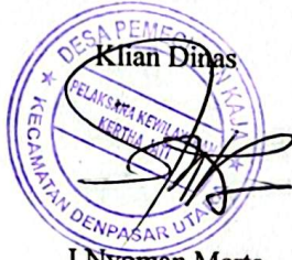
I Nyoman Merta

Res No. 24 / um / 4 / 2020 Kepala Desa Pemecutan Kaja,