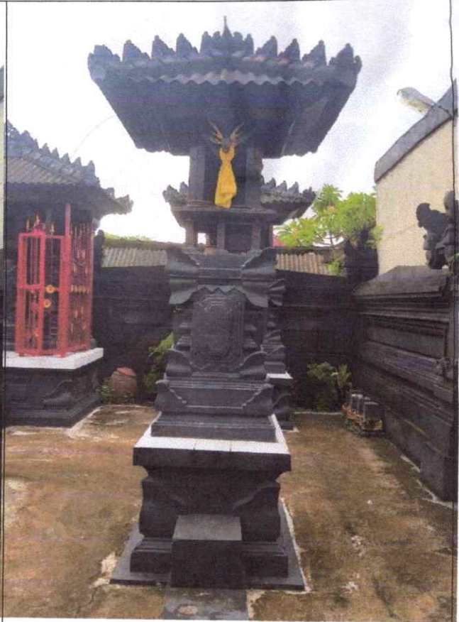
Pelinggih Menjang Sluang