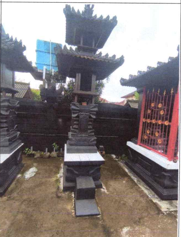
Pelinggih Meru Tumpang Kalih