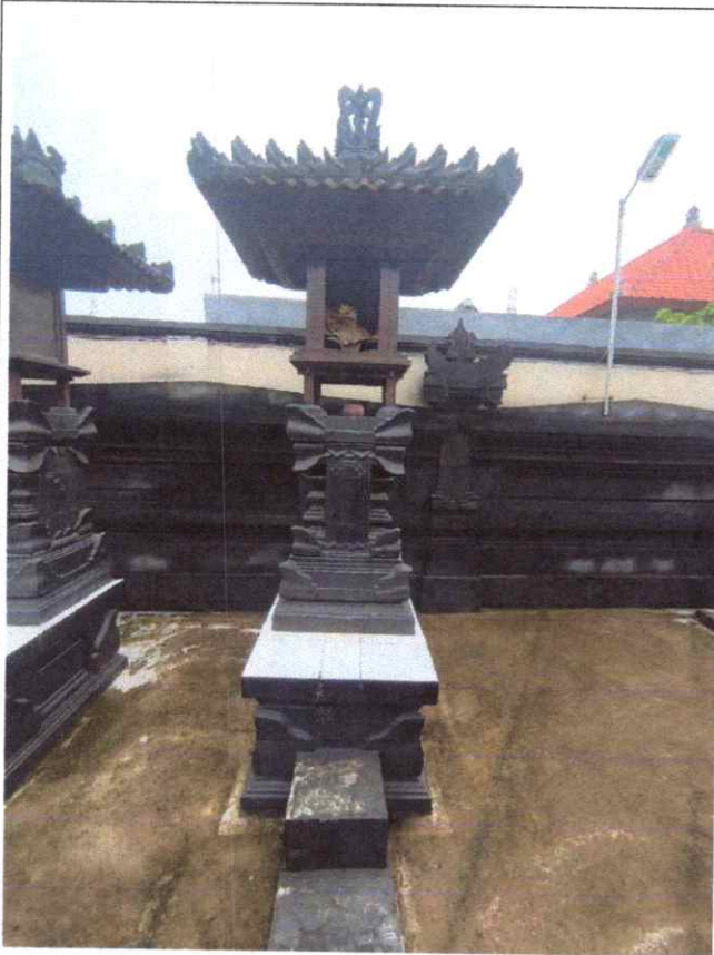
Pelinggih Sri Sedana