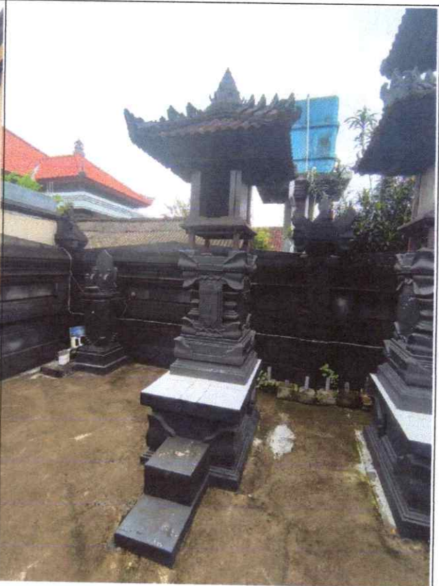
Pelinggih Gedong Tarib