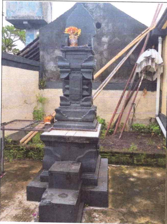
Pelinggih Tugu Karang