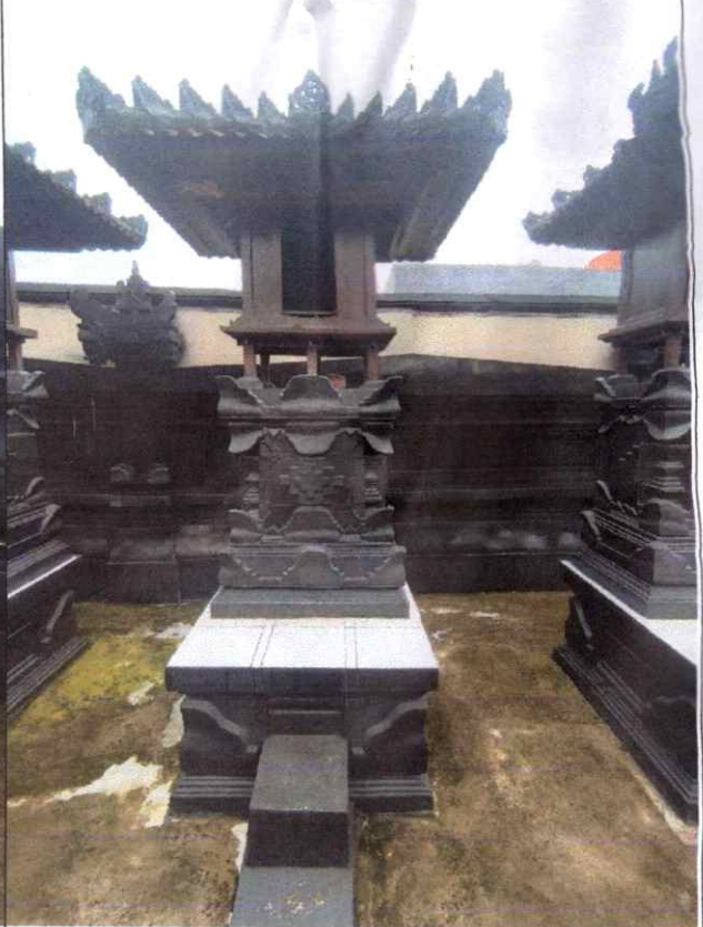
Pelinggih Gedong Saren