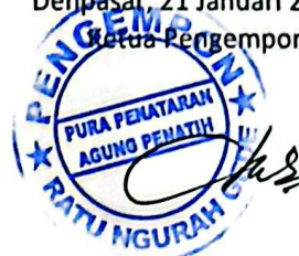
I Made Wedha

Denpasar, 21 Januari 2026 Ketua Pengempon