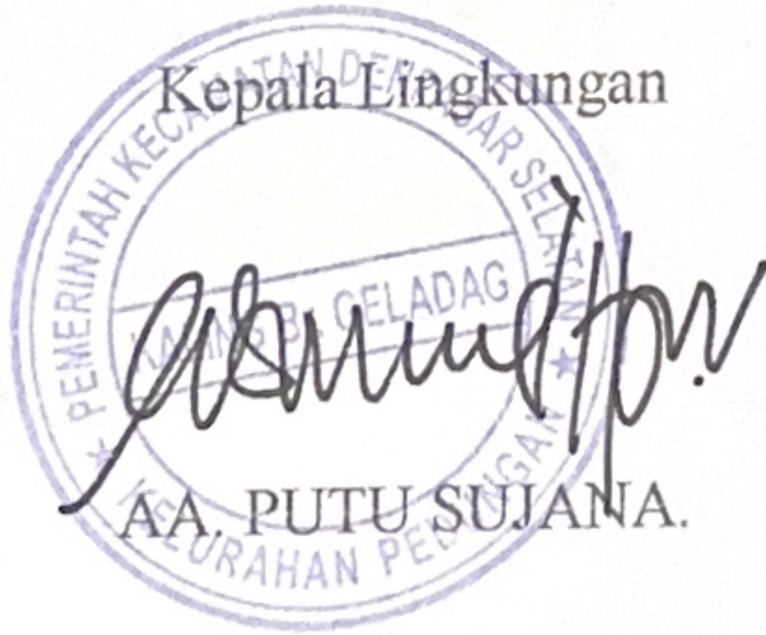
AA PUTU SUJANA.