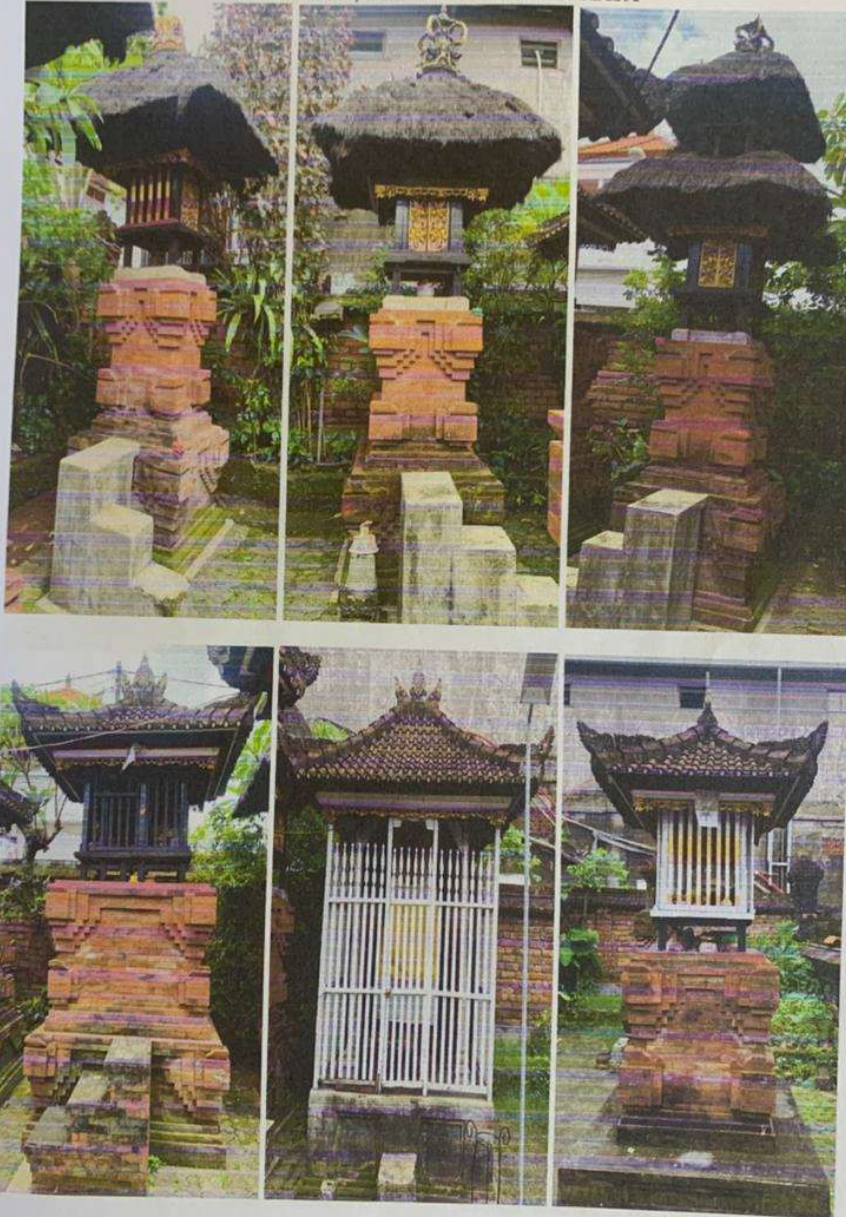
FOTO DOKUMENTASI MERAJAN GEDE PASEK KAYU SELEM Br. BALUN, DESA PEMECUTAN KAJA