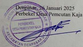
Anak Agung Ngurah Arwatha

Demikian Surat Keterangan ini dibuat dengan sebenarnya untuk dapat dipergunakan untuk pengajuan proposal.