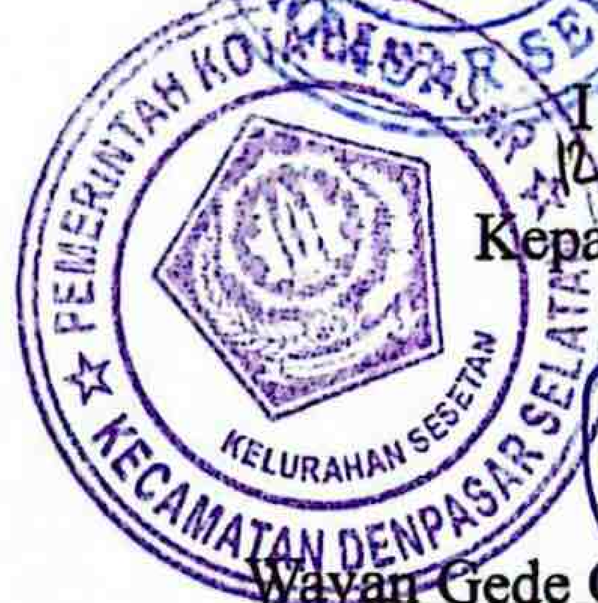
I Made Sudama,S.SN