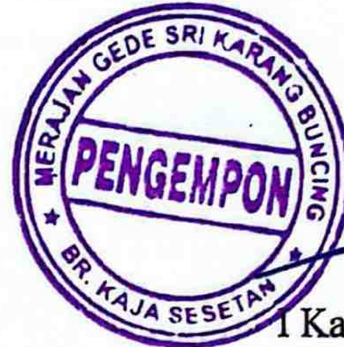
I Kadek Untung Sukawinastra