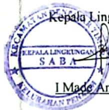
I Made Anom Sastrawan