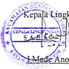
I Made Anom Sastrawan