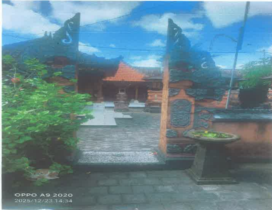
FOTO TEMBOK PENYENGER DAN CANDI BENTAR

Alamat Jalan Sentaka Gang II No 4 Banjar Kedaton Desa Kesiman Petilan