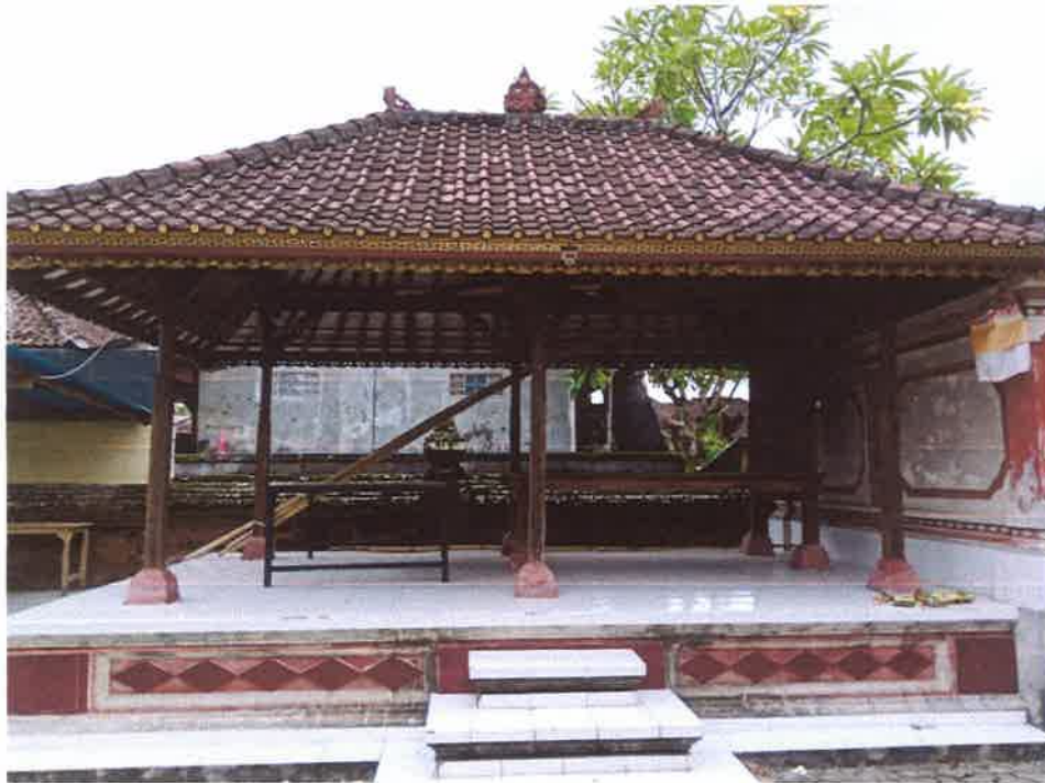
BALE PIYASAN TAMPAK SAMPING