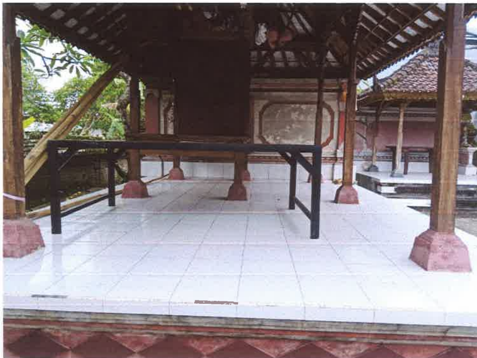
BALE PIYASAN TAMPAK DEPAN