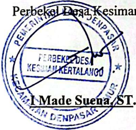
I Made Suesa, ST.