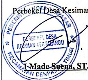
I Made Sirena, ST.