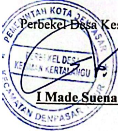
I Made Suena, ST.