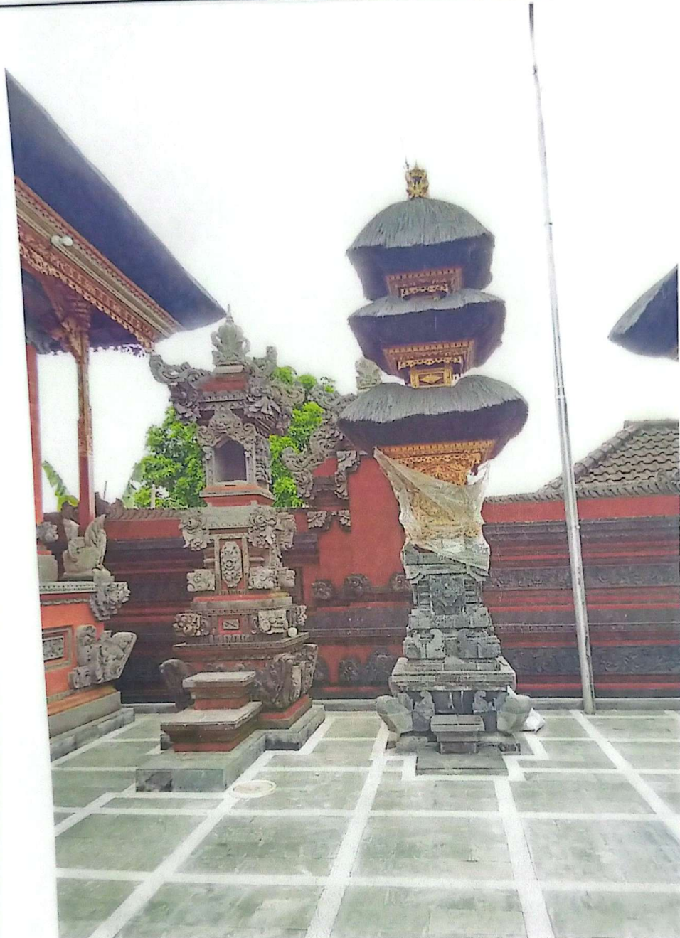
MERU MATUMPANG TELU

Jl. Gunung Tangkuban Perahu Lingkungan/Br. Anyar, Kel. Padangsambian, Kec. Denpasar Barat Kota Denpasar