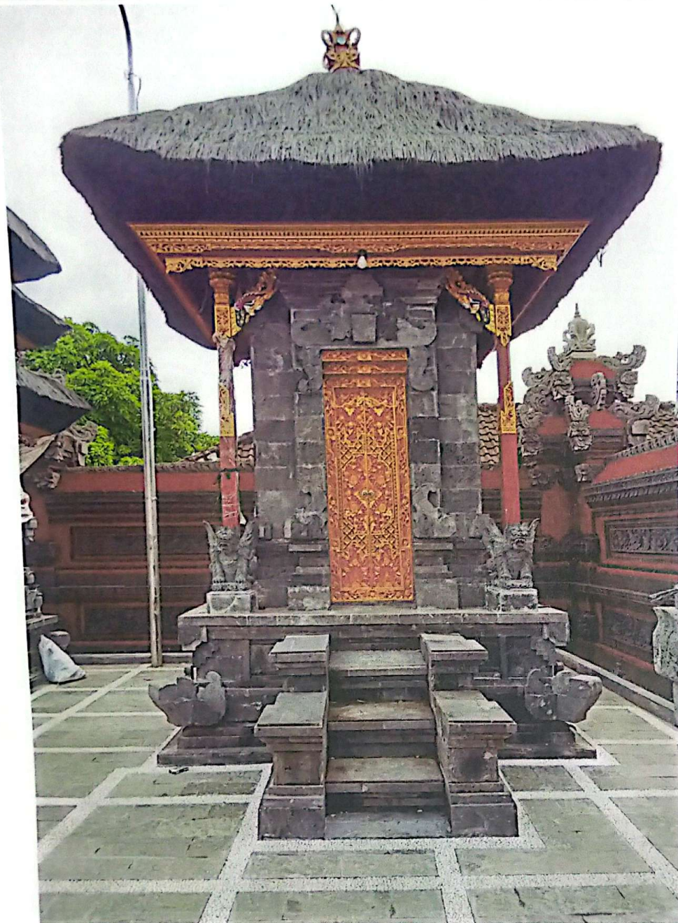
GEDONG LINGGA STANA IDA BHATARA HYANG ABASAN

Jl. Gunung Tangkuban Perahu Lingkungan/Br. Anyar, Kel. Padangsambian, Kec. Denpasar Barat Kota Denpasar