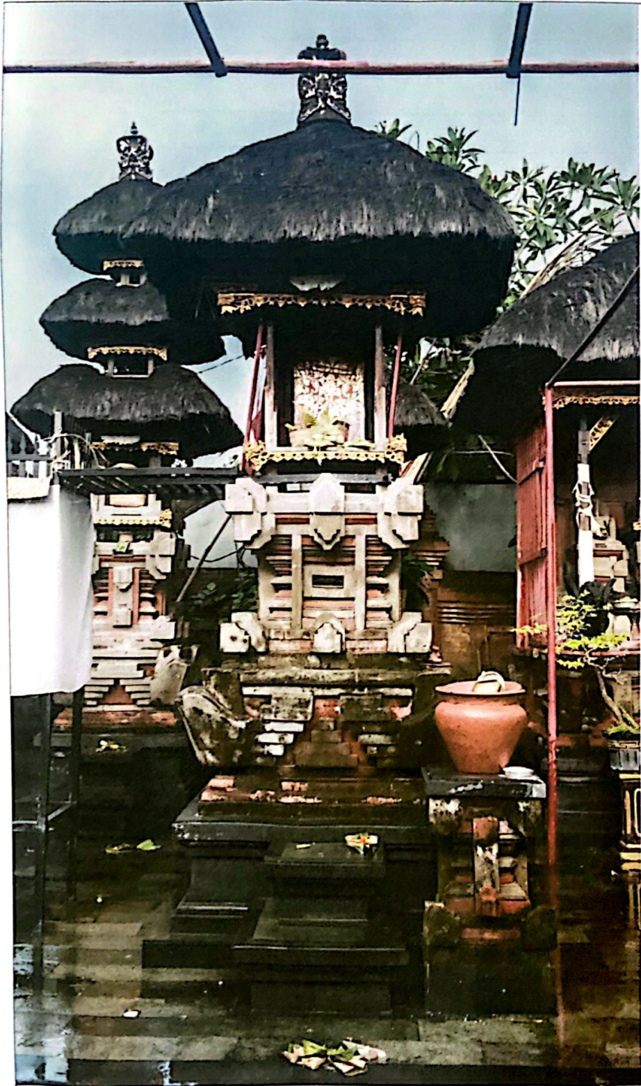
FOTO – FOTO KEADAAN MERAJAN PANDE PEGOK SESETAN