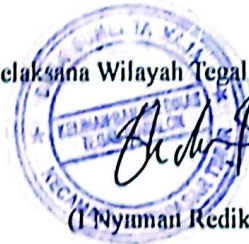
(I Nyuman Redika)