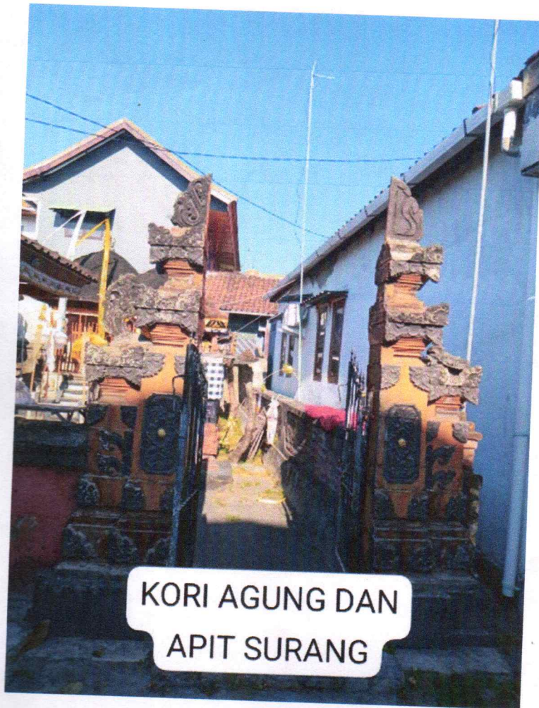
APIT SURANG SEBELUM DI PUGAR