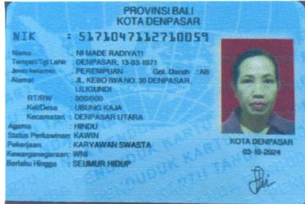
FOTO COPY KTP PENGURUS PAKIS BR. ADAT LILIGUNDI

Email : pakisbrililigundiubungkaja@gmail.com