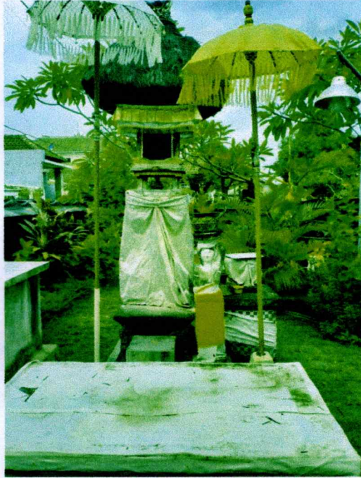
PHOTO PELINGGIH DAN PIASAN