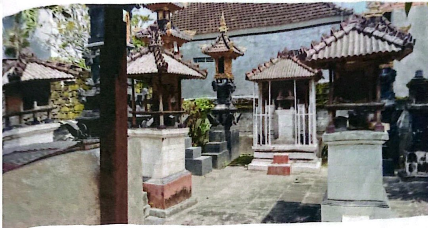
FOTO DOKUMENTASI MERAJAN SAAT INI

Alamat : Jalan Tk Punggawa I Gg Bronkeli No. 3 Serangan