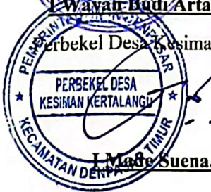
I Made Suena, ST