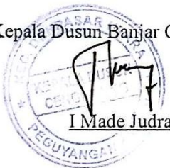
I Made Judra