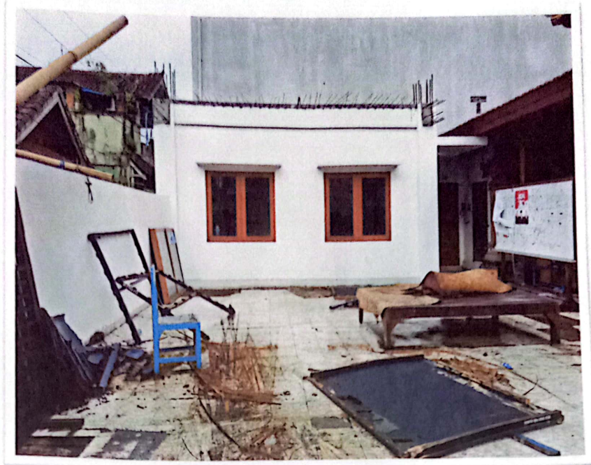
FOTO BANGUNAN EXSISTING

၁၁၁၁၁၁၁၁၁၁၁၁ DESA ADAT DENPASAR ကုလသမဂ္ဂတက္ကသိုလ် KEC. AMATAN DENPASAR BARAT ၇၇၇၇၇၇၇၇၇၇၇၇ Jl. Sutoyo No. 11 Denpasar Barat 80112. banjaradatgemeh@gmail.com