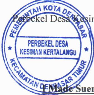
I Made Suena, ST