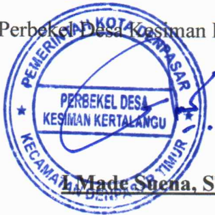
I Made Suena, ST