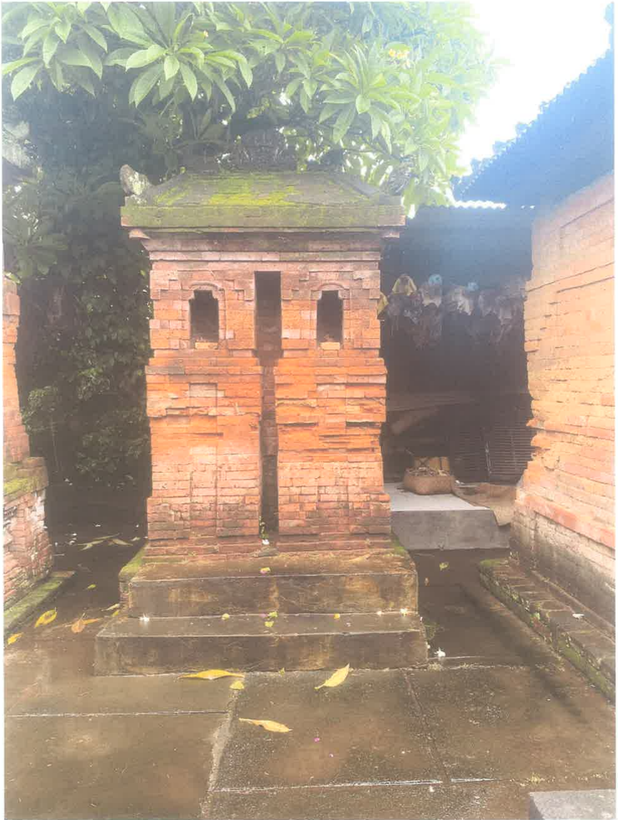
Foto Gedong Kembar Yang Akan di Perbaiki