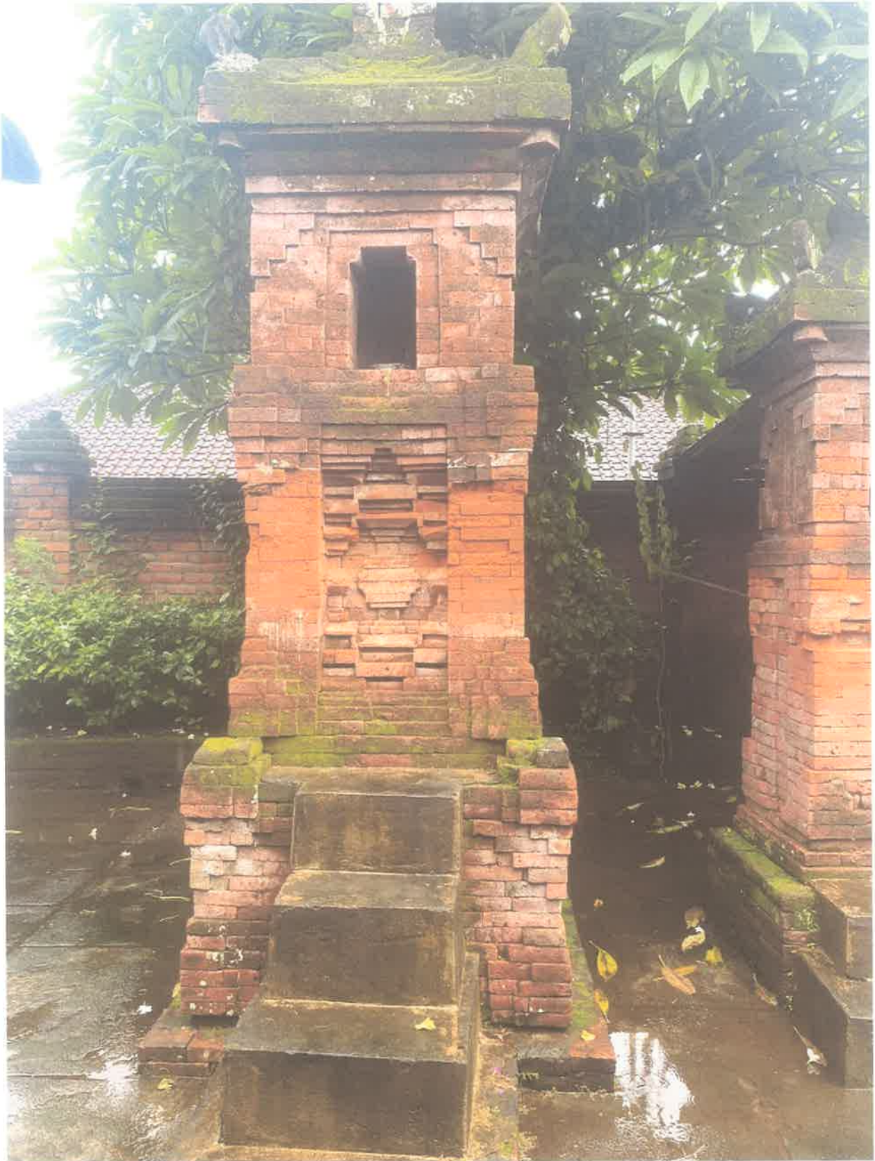
Foto Gedong Maspait Yang Akan di Perbaiki