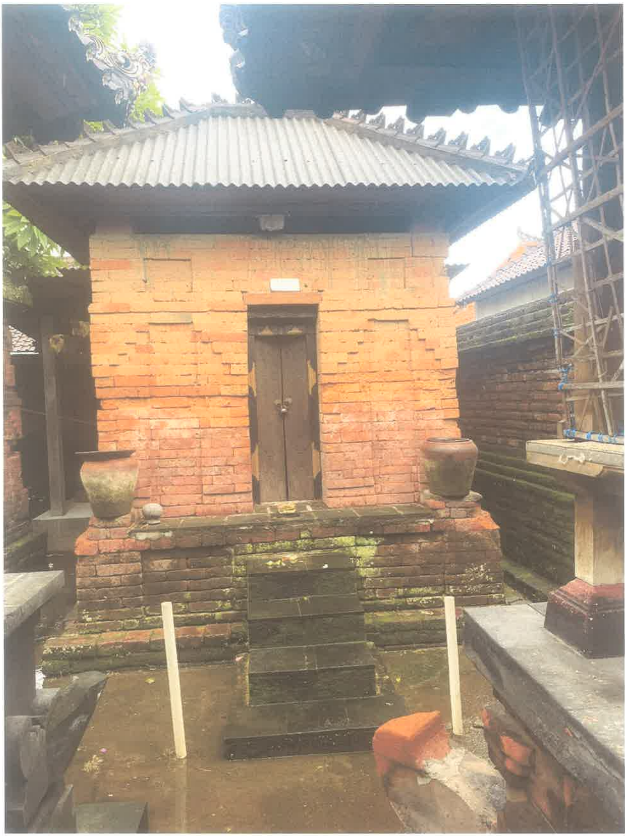
Foto Gedong IBU Yang Akan di Perbaiki