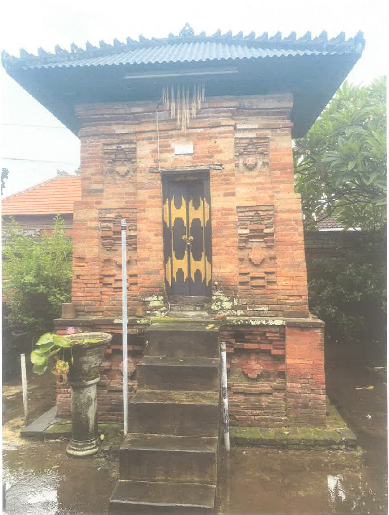
Foto Gedong Pemayun Yang Akan di Perbaiki