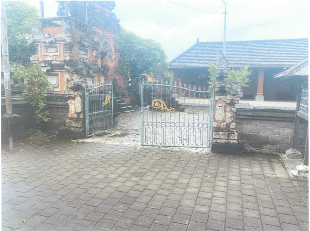
Foto Tembok Penyengker dan Candi Bentar Yang Akan di Perbaiki