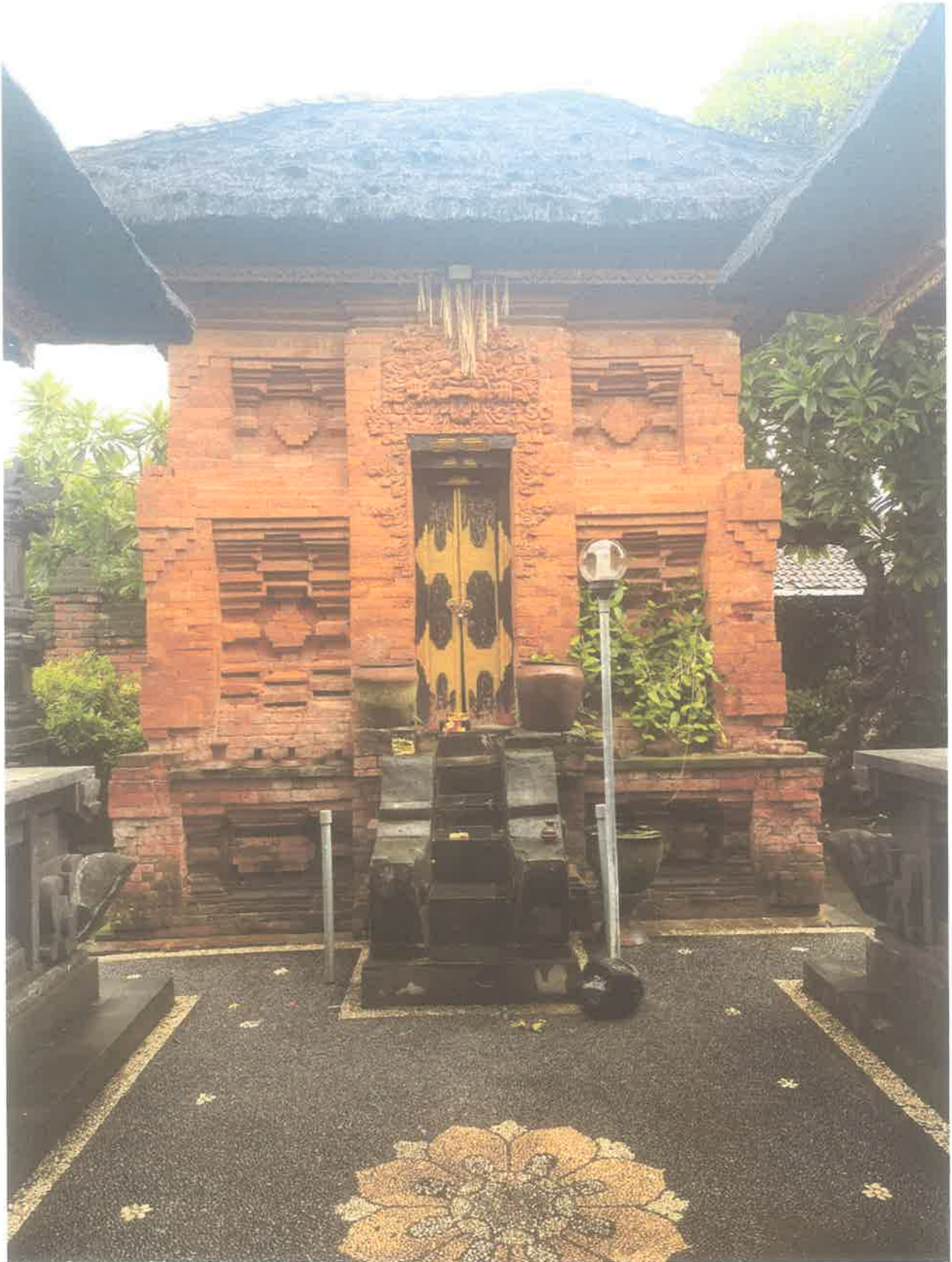
Foto Gedong Ratu Yang Akan diPerbaiki