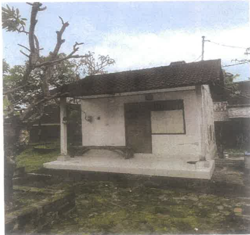
Foto Pewaregan Dan Gudang Alat Upakara